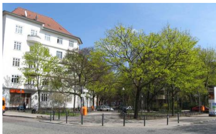
Esperantoplaco atingeblas de S-trajn-stacidomo Sonnenallee rekte trans Siegfried-Aufhäuser-placo tra Schwarzastrato.

Kunagu por publike prezenti la funkciantan Esperanton kaj ĝian kulturon! Ni atentigu pri nia jubileo «111 jaroj Esperanto en Berlino kaj Brandenburgio» kaj pri problemoj sur kaj ĉirkaŭ la placo!